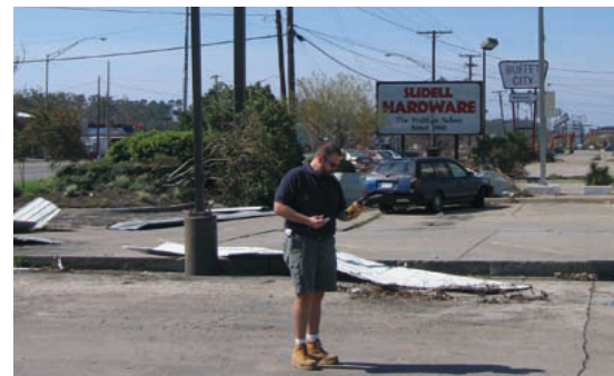
Abb. 1: Geoexperten der Münchener Rück bei der Schadeninspektion wenige Tage nach Hurrikan Katrina.

Auf der Basis von Straßendaten war eine optimale Routenplanung möglich, Risiken wurden rasch identifiziert. Durch die Einbindung erster Schadenkartierungen, die von der FEMA (Federal Emergency Management Agency) bereitgestellt wurden, konnten bedeutende Einzelschäden schnell identifiziert und bewertet werden. Zahlreiche Einzeldrucke und die unterschiedliche Schadenanfälligkeit von Privat-, Gewerbe- und Industrierisiken ermöglichen es, ein erstes Bild über das Schadenausmaß zu gewinnen. Auch für die Ölplattformen im Golf von Mexiko wurden im letzten Jahr Geodatenbanken aufgebaut. Nach den Hurrikanen 2005 ließen sich die Schäden in Abhängigkeit von den Windgeschwindigkeiten sehr gut schätzen.